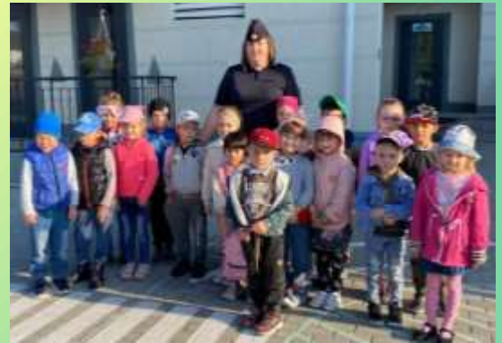
Профилактический час при участии инспектора ГИБДД в МДОУ детский сад №2

В родительских чатах распространялись информационные памятки, буклеты, видеоролики по профилактике БДД.