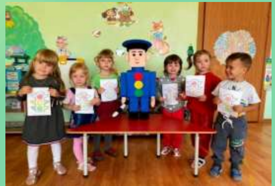
Выставка детских рисунков «Зеленый огонек» в МДОУ детский сад №9