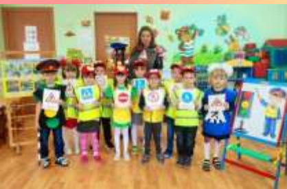
МДОУ детский сад № 9