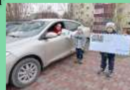
МДОУ детский сад №4 «Калинка»