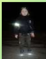
Дошкольная группа МОУ Тулянская ООШ

соблюдать Правила дорожного движения и обезопасить себя на дороге, используя в одежде световозвращающие элементы.