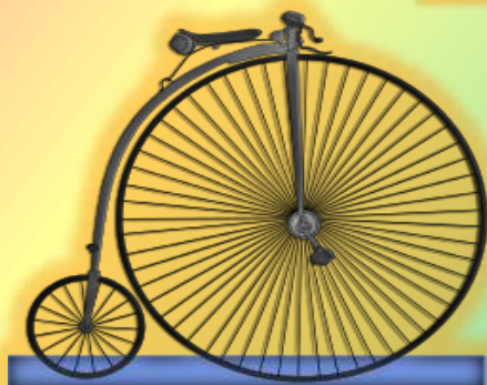
1870 большеколёсный велосипед Джеймс Старли Франция