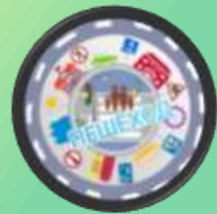
Логотипы ЮПИД МДОУ д/с № 9; МДОУ д/с №4 «Калинка»