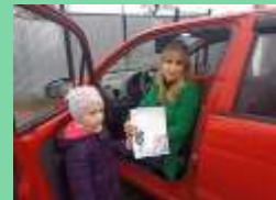
МДОУ детский сад с. Принцевка