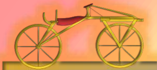
1818 дрезина Карл фон Дрез Германия