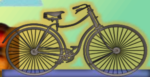
1885 безопасный велосипед Джон Кемп Старли Англия

Первые велосипеды появились в Германии в 1817 г. Немецкий профессор барон Карл фон Дзер создал первый двухколёсный самокат, который он назвал, «машиной для ходьбы». Самокат был снабжён рулём и выглядел как велосипед без педалей. Он был сделан из дерева и рама, и руль, и колёса – всё было деревянное. Движения велосипедиста напоминало работу ног лыжника: человек передвигался, отталкиваясь ногами от земли, сидя на деревянной раме.