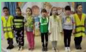
МДОУ детский сад №2