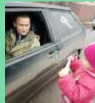
МДОУ детский сад с. Сухарево

Дошкольники совместно с родителями и педагогами написали письма для водителей с напоминанием о необходимости соблюдать правила дорожного движения и быть внимательным на дорогах. В ходе акции дети вручали письма водителям.