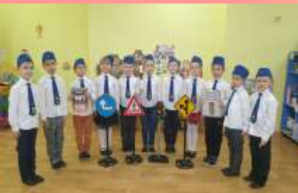
МДОУ детский сад № 5