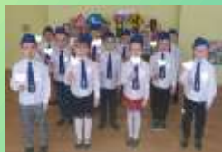
МДОУ детский сад №5