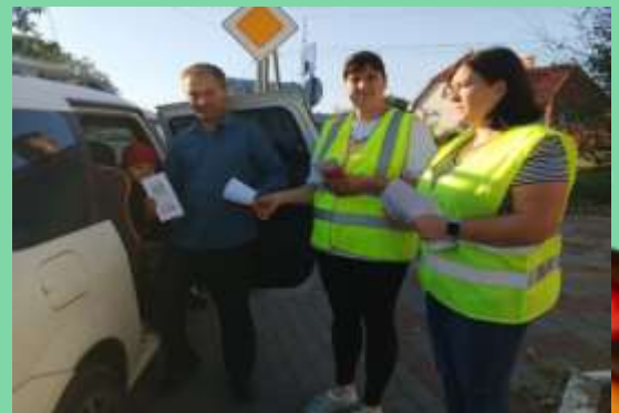
Операция «Родительский патруль» МДОУ детский сад №4 «Калинка»