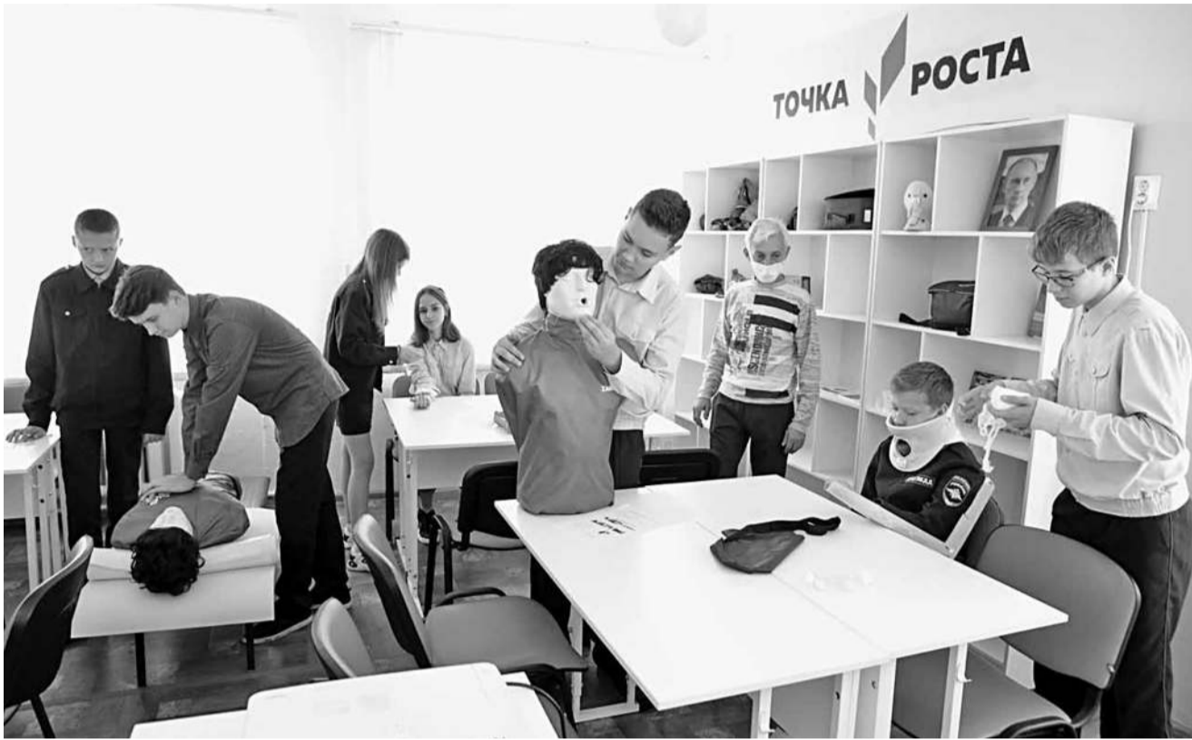
Занятия по оказанию первой медицинской помощи

Конечно, «Точкой роста» сейчас никого не удивишь. В Белгородской области уже привыкли, что даже небольшие сельские школы постепенно оснащаются современным оборудованием, а ребята учатся программировать, конструировать, управлять квадрокоптерами и легко осваивают цифровую технику.