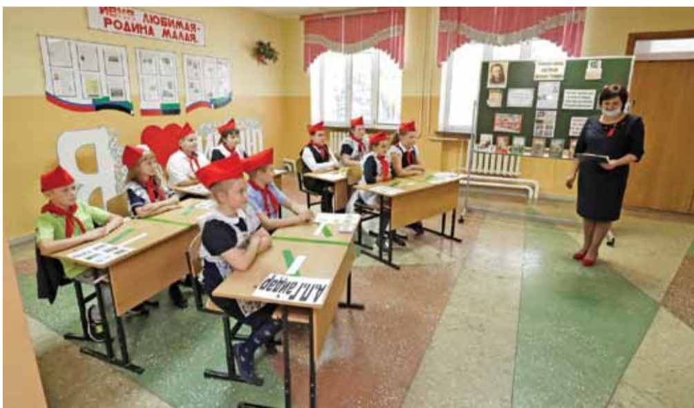
Занятие, посвящённое творчеству Аркадия Гайдара, во время внеурочной деятельности в Ивнянской школе № 1

Так что первым учеником курсов японского языка станет сам директор!