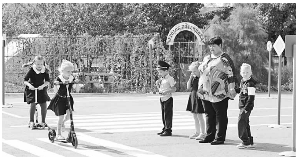
В «Автогородке» школьники на практике учат Правила дорожного движения

ЗА 45 ЛЕТ КЛИМЕНКОВСКАЯ ШКОЛА ВЫПУСТИЛА 575 УЧЕНИКОВ, 24 ИЗ НИХ НАГРАЖДЕНЫ ЗОЛОТЫМИ И СЕРЕБРЯНЫМИ МЕДАЛЯМИ, 30 СТАЛИ ПЕДАГОГАМИ (12 ИЗ НИХ ВЕРНУЛИСЬ ПРЕПОДАВАТЬ В РОДНУЮ ШКОЛУ).