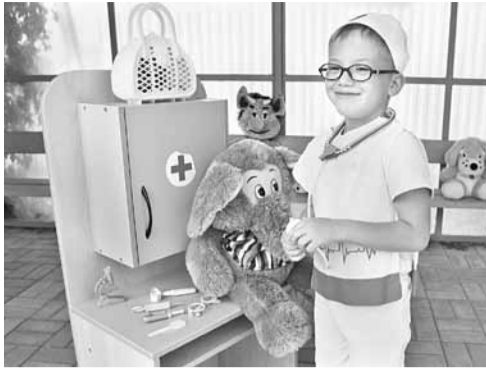
В «Ветклинике» дошколята печат плюшевых зверей