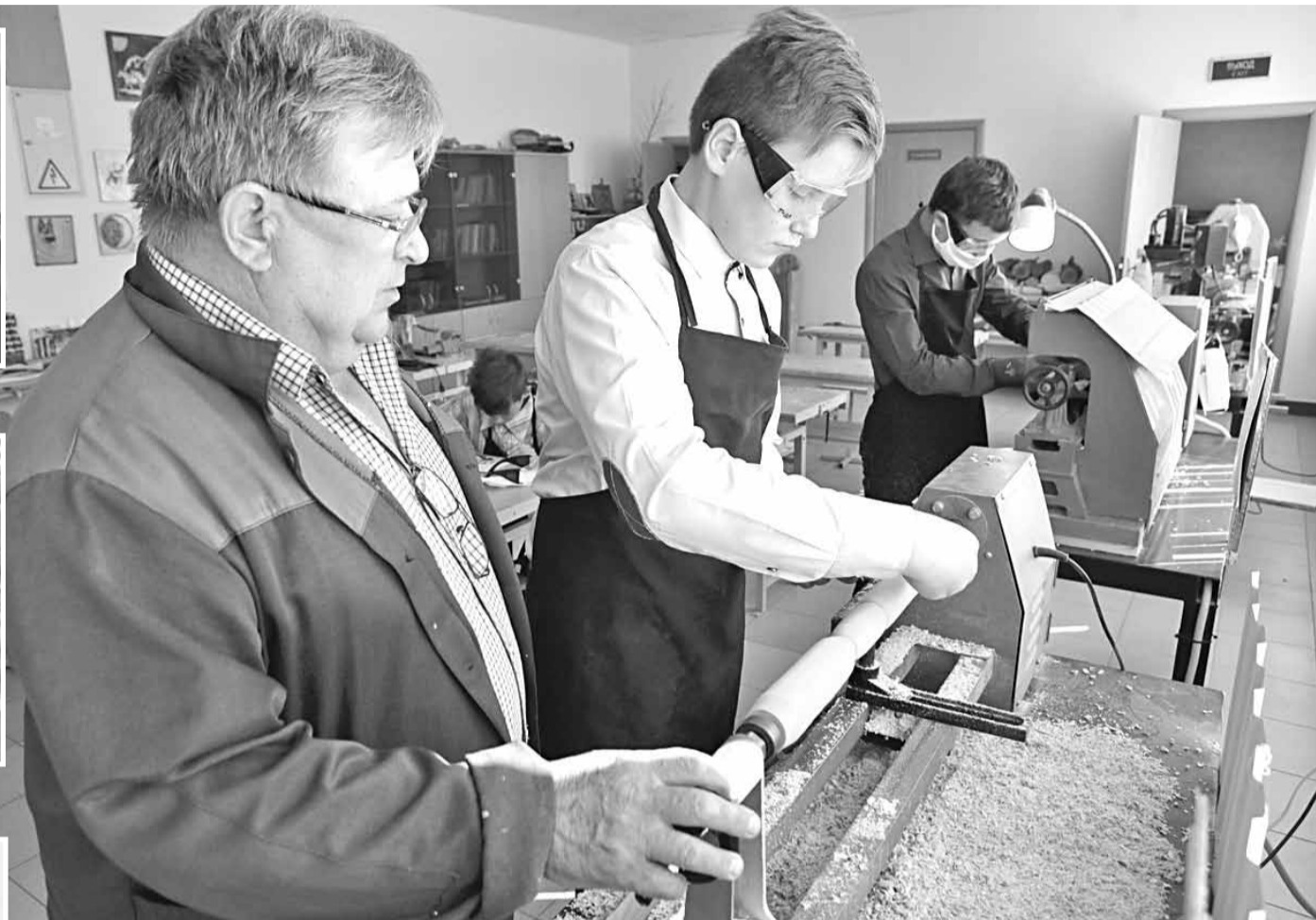
На уроке технологии в школьной мастерской