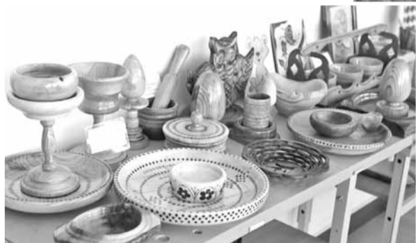
Изделия из дерева, сделанные школьниками на уроках технологии