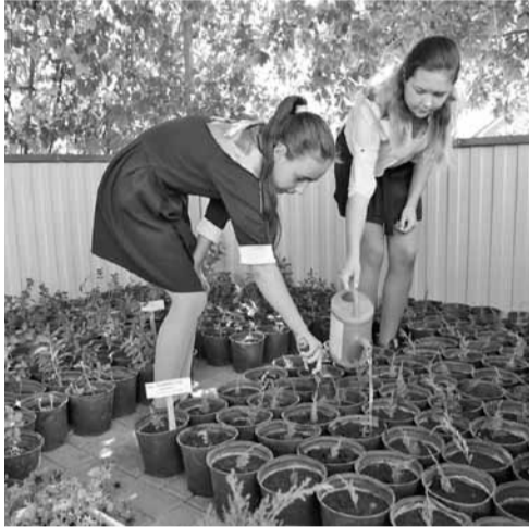
В школе выращивают растения с закрытой корневой системой