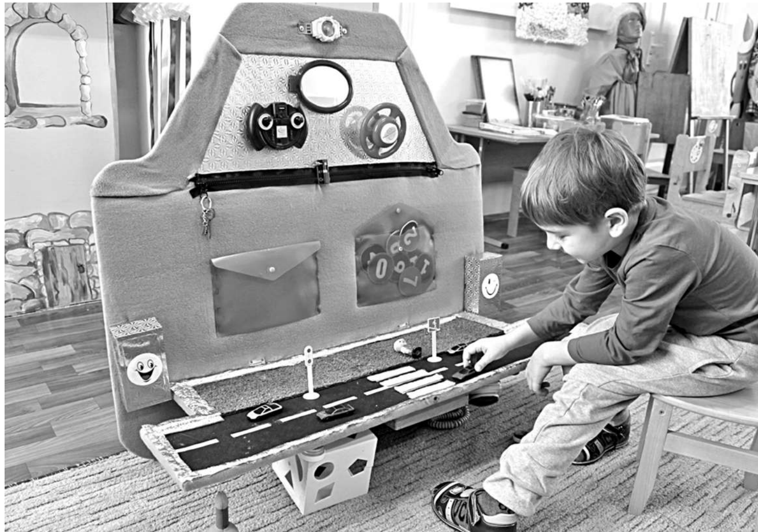
Игровая зона в детском саду № 8

СЕГОДНЯ СВОИМ ОПЫТОМ ДЕЛЯТСЯ УЧРЕЖДЕНИЯ ОБРАЗОВАНИЯ НОВООСКОЛЬСКОГО ГОРОДСКОГО ОКРУГА