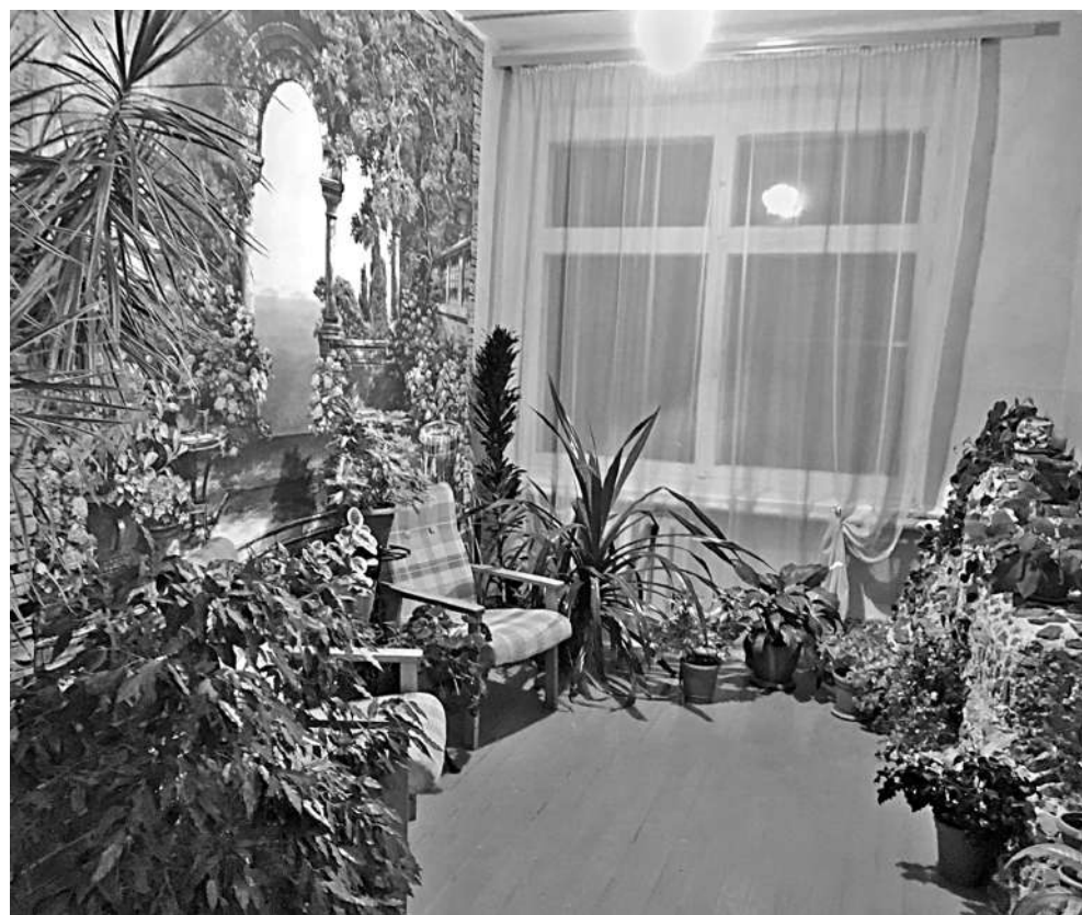
Зимний сад в Васильдольской школе

Большую часть дня дети проводят в школе, поэтому там решили украсить помещения вечнозелёными растениями. Так появился проект «Зимний сад в школе», способствующий художественно-эстетической организации интерьера, а ещё он оздоравливает среду, оказывает положительное психофизиологическое действие на учеников, даёт возможность отдохнуть от физических и нервных нагрузок.