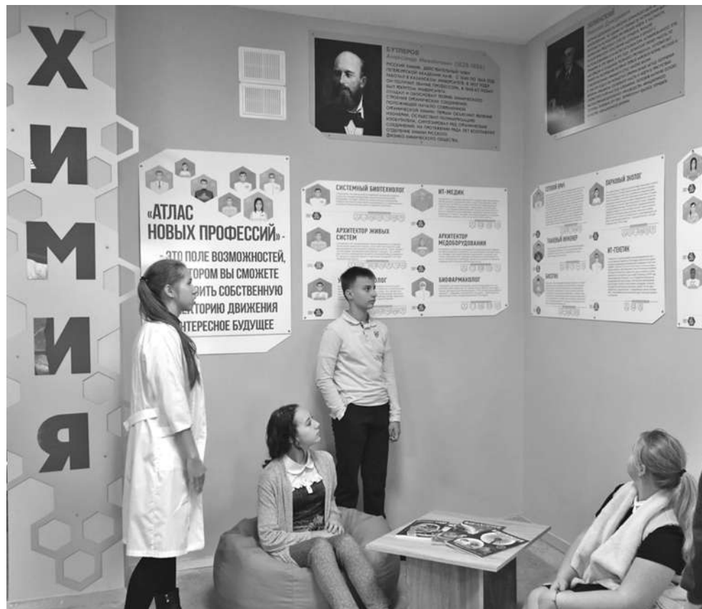
Профориентационная зона в школе № 1