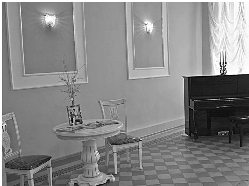
Ольгинский зал школы № 1