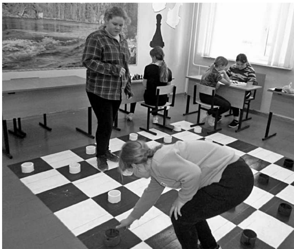
Игровая зона в Глинской школе