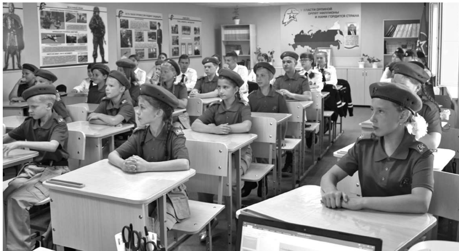
Кадетский класс школы № 1

КОЛЛЕГИ! МЫ ПРИГЛАШАЕМ ВАС СТАТЬ НЕ ТОЛЬКО ЧИТАТЕЛЯМИ, НО И АВТОРАМИ ГАЗЕТЫ!