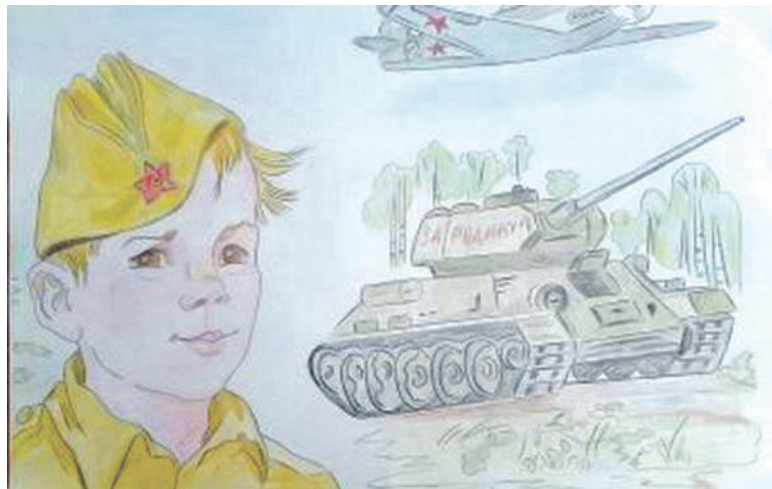
Рисунок Дарьи Лопиной (Корочанская школа им. Д. Кромского)