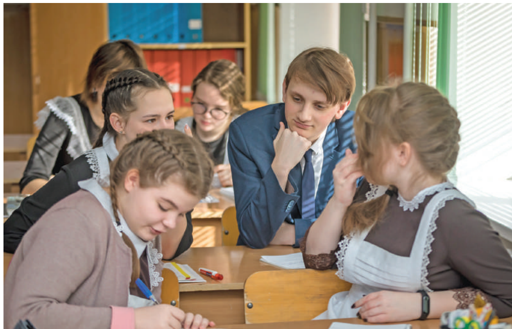
Урок обществознания в 10-м «Б» классе

Ольга МУШТАЕВА » ТЕКСТ