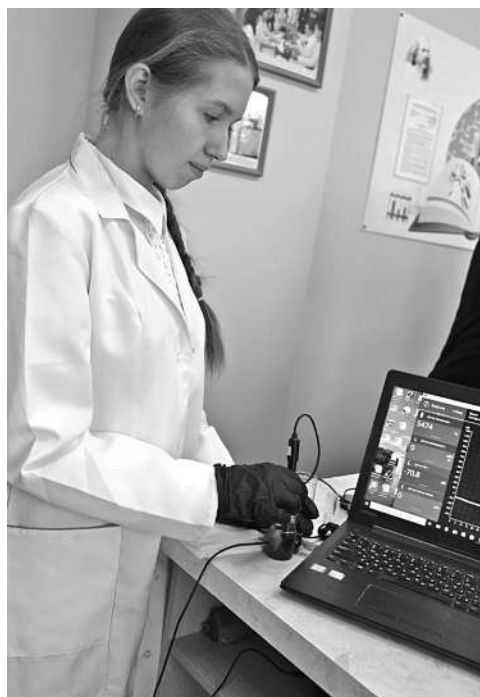
В школе № 1