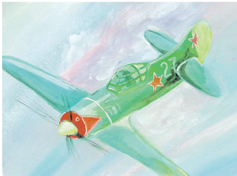
Воздушный бой. Рисунок Дмитрия Новикова (Корочанская школа им. Д. Кромского)