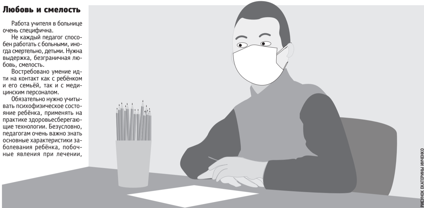
РИСУНОК ЕКАТЕРИНЫ ИЩЕНКО

Задачу педагогов вижу в том, чтобы они помогли детям не отстать от своих одноклассников в освоении программного материала.