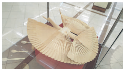
Архангельская щепная птица