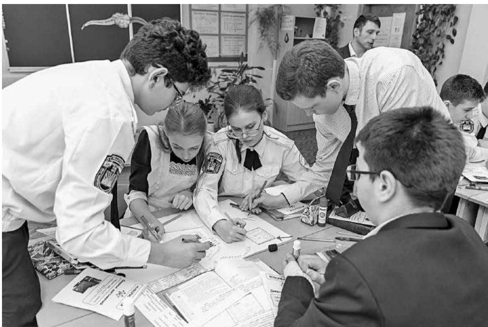
Заполнение ментальной карты