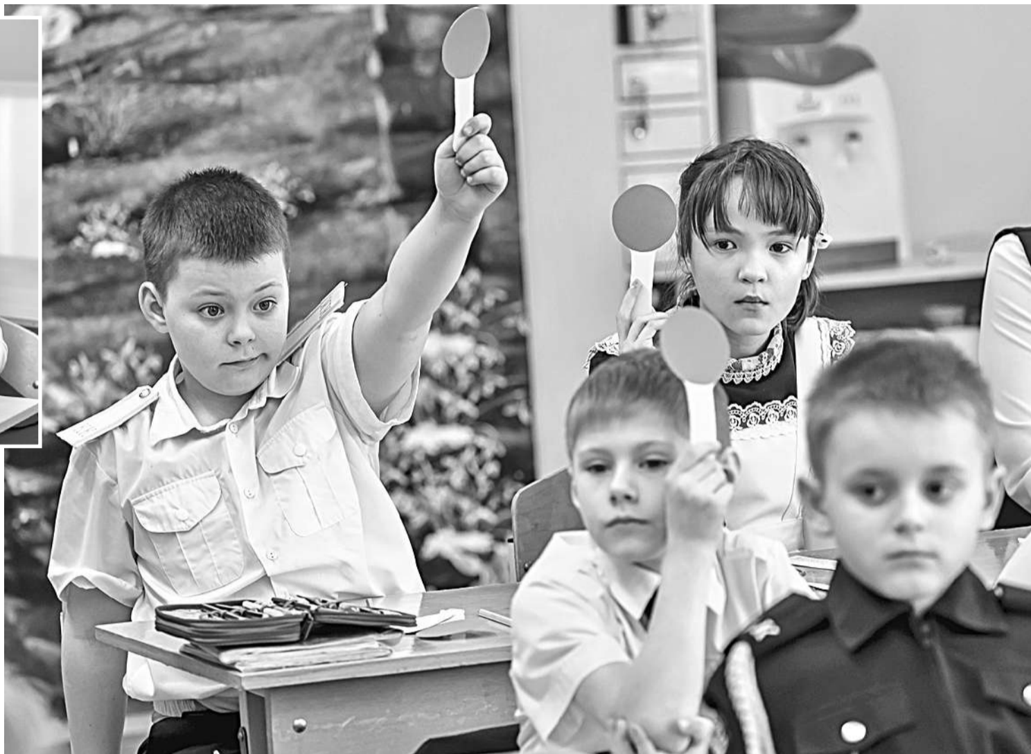
Использование техники «Светофор» в начальной школе

Задания разные: схемы, вопросы (в том числе в формате «допиши фразу или предложение») и даже ребусы. Выполнить их ребята должны за определённое