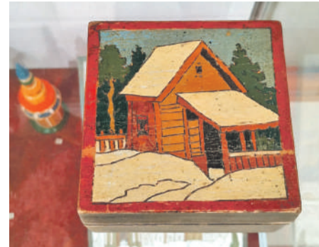
Шкатулка-коробочка «Зима в деревне» (1930-е гг.)