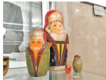
Набор матрёшек «Боярыни» (1910-е гг.)