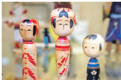
Японские куклы кокэси