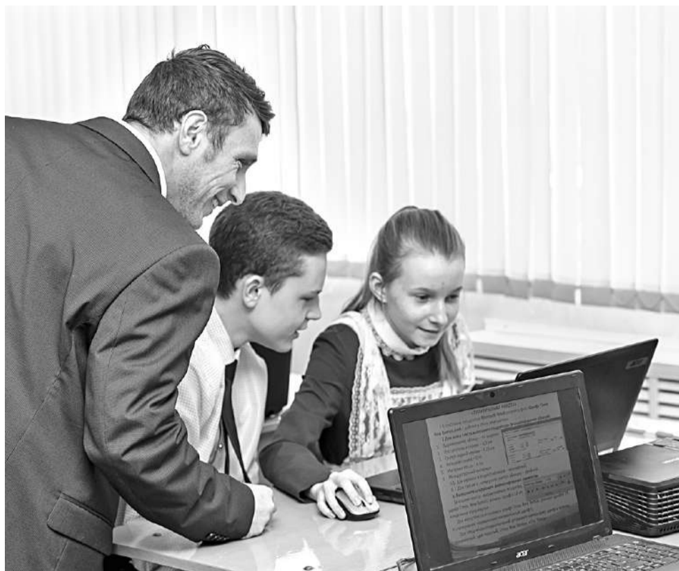
Ребята выполняют практическое задание на компьютере

Учитель раздаёт ребятам карточки с вопросами: «Чему я научился за эту неделю?», «Какие вопросы для меня остались неясными?», «Какие вопросы