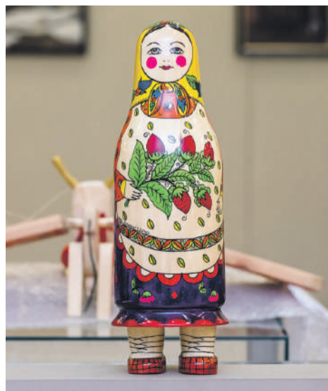
Матрёшка на ножках

А ещё на выставке вы увидите своеобразную «японскую матрёшку» — кокэси, характерная особенность которой — цилиндрическое тело с прикреплённой головой и отсутствие рук и ног. Эти куклы, покрытые росписью, появились в Японии ещё в XVII веке и до сих пор пользуются огромной популярностью у японцев самого разного возраста. Любопытно, что заготовки для этой куклы делают в России!