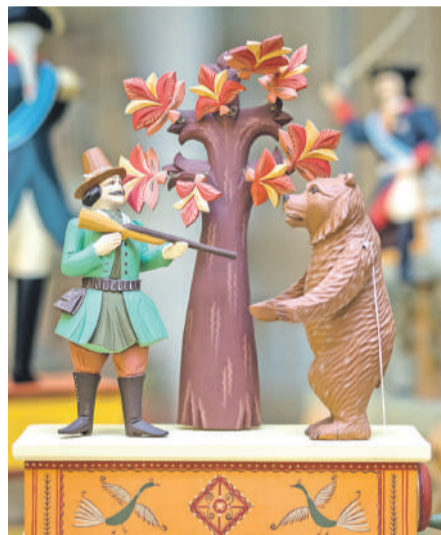
Деревянная игрушка «Охотник и медведь» мастера Олега Михайлова